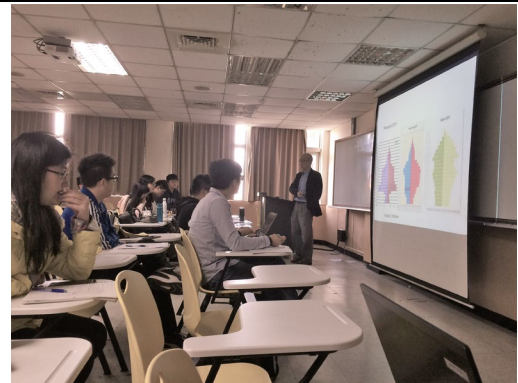
Q & A