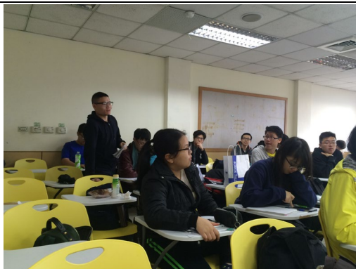
Q & A