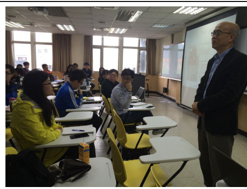
Q & A