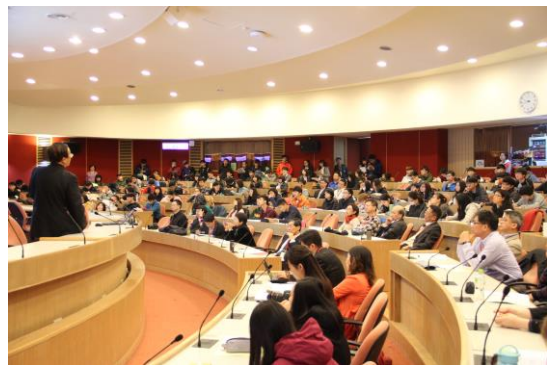
3月25日於2017地科論壇演講情形